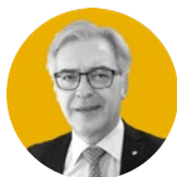
Salvatore Requirez , Dirigente Generale del Dipartimento Attività Sanitarie e Osservatorio Epidemiologico dell'Assessorato per la Salute

Comitato Scientifico Associazione Periplo