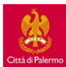
Città di Palermo